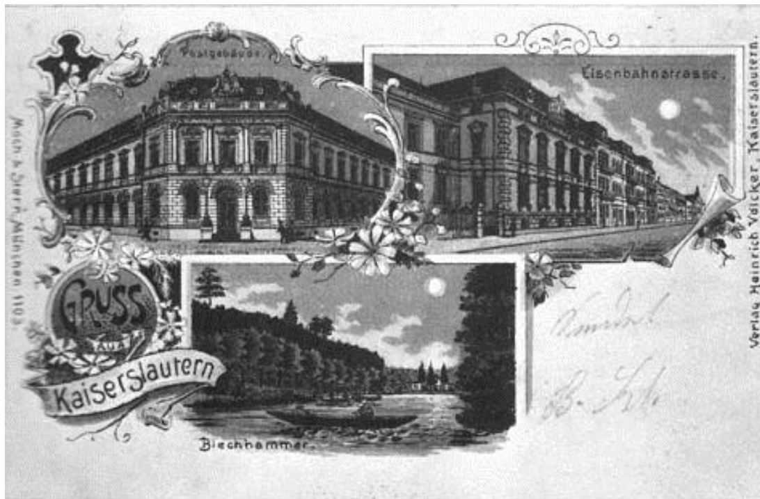
Postkarte „Gruss aus Kaiserslautern“, um 1890, Ansicht Postgebäude, Eisenbahnstraße und romantische Kahnpartie am Blechhammer

Weingut Heinrich Gies, Friedelsheim, Cabernet Sauvignon, D.Q. trocken, 0,75 l | € 21,90