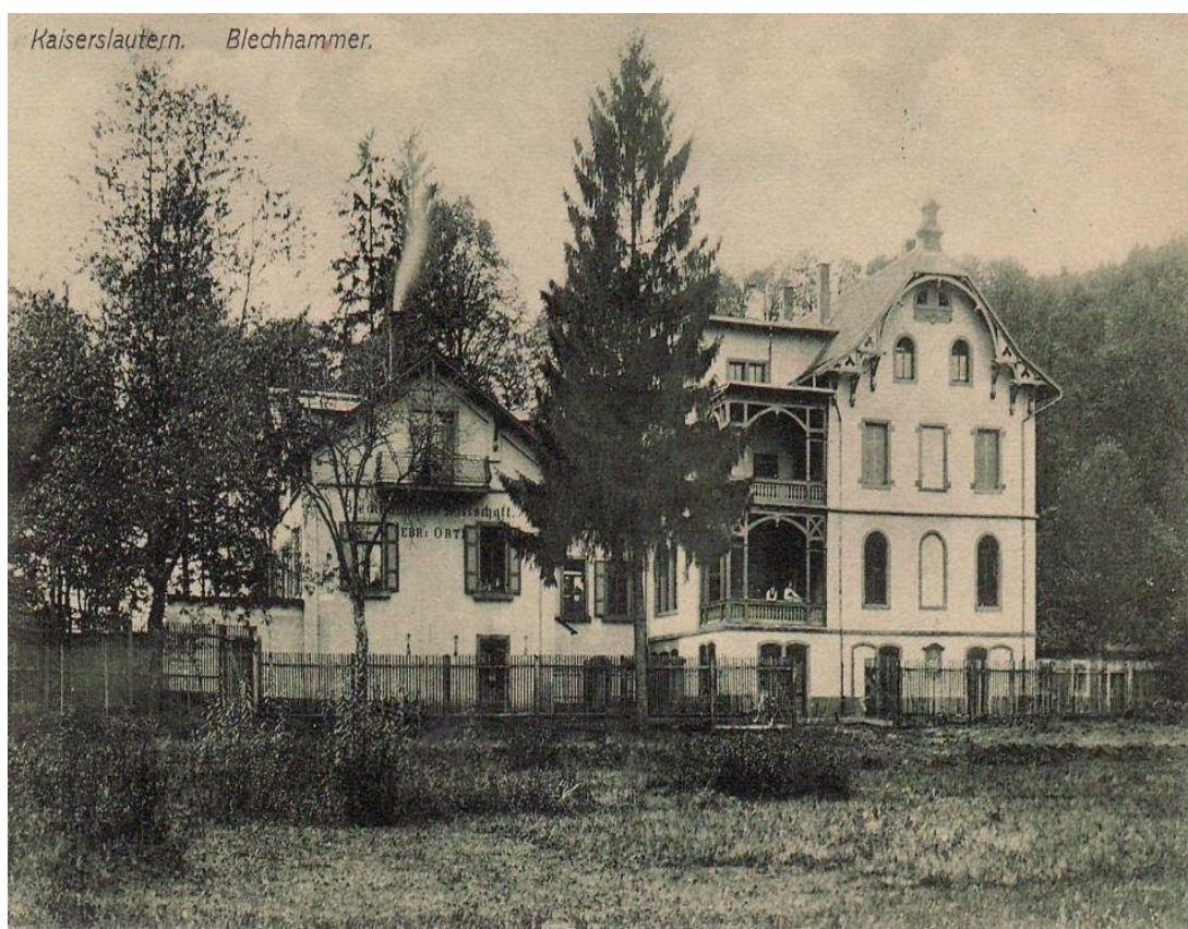
Historische Ansicht des Blechhammers, um 1900