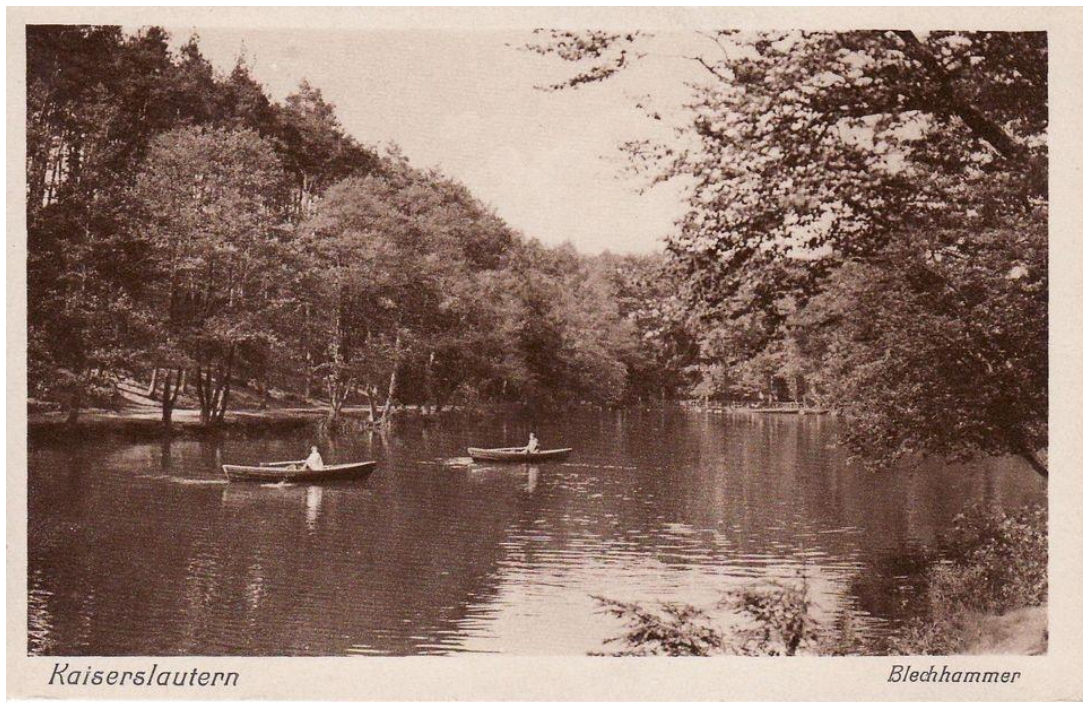
Kahnpartie auf dem Blechhammer